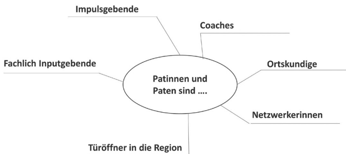
Abb. 2: Die Rollen der Patinnen und Paten (eigene Darstellung)

Auch auf die Patinnen und Paten kommen damit ganz verschiedene Rollen zu (siehe Abb. 2): Sie sind Impulsgebende und Fachleute, Coaches und Motivierende, Netzwerkende und Türöffner in die Region. Anders als Lehrende übernehmen sie die Patenrolle meist nicht als Teil ihrer regulären Tätigkeit, sondern als zusätzliche Aufgabe, deren Umfang daher auch überschaubar bleiben sollte.