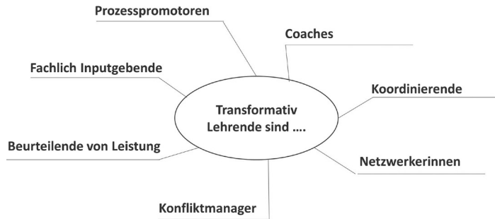
Abb. 1: Die Rollen transformativ Lehrender (eigene Darstellung)

Vielfalt an Qualifikationen der Lehrenden erforderlich