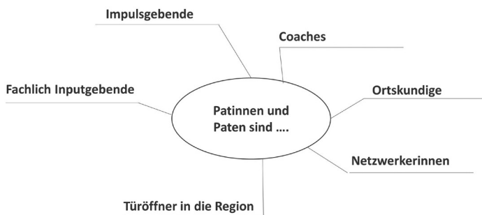
Abb. 2: Die Rollen der Patinnen und Paten (eigene Darstellung)

Auch auf die Patinnen und Paten kommen damit ganz verschiedene Rollen zu (siehe Abb. 2): Sie sind Impulsgebende und Fachleute, Coaches und Motivierende, Netzwerkende und Türöffner in die Region. Anders als Lehrende übernehmen sie die Patenrolle meist nicht als Teil ihrer regulären Tätigkeit, sondern als zusätzliche Aufgabe, deren Umfang daher auch überschaubar bleiben sollte.