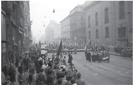
Abb.II.6.7 Demonstrationen in Budapest, die in den Aufstand von 1956 mündeten.

Die unter Nikita Chruschtschow auf dem XX. Parteitag der KPdSU im Februar 1956 eingeleitete Entstalinisierung brachte zwar den Sturz Rákosis mit sich. Es konnte nicht verhindert werden, dass die wachsende Unzufriedenheit mit der kommunistischen Einparteien-Diktatur, der anhaltende Terror und das Vorbild des Aufstandes in Polen im Oktober 1956 zum „Ungarnaufstand“ führten. Durch den Einsatz sowjetischen Truppen wurde er niedergeschlagen. Die westliche Welt hielt sich zurück, obwohl ein Eingreifen in einigen westlichen Staaten, darunter den USA, von gesellschaftlichen Gruppen gefordert wurde.