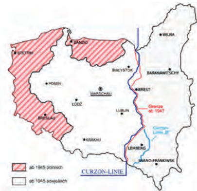
Abb.II.4.5 Neue polnische Grenzen nach dem Zweiten Weltkrieg

Die Neuordnung Europas begann auf der Konferenz von Teheran (28.11.–1.12.1943), als die westlichen Vertreter der sowjetischen Forderung nachgaben, nach Beendigung des Krieges Polen dem Einflussbereich der Sowjetunion zu überlassen. Dies bedeutete de facto die Unterwerfung eines zukünftigen Polen unter den sowjetischen Totalitarismus. Diese Beschlüsse wurden der polnischen Exilregierung vorenthalten, welche ihren Sitz in London hatte. Das geschah, obwohl Polen ein Alliiertes der Westmächte war.