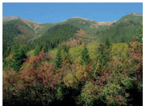
Abb.II.4.2 Hohe Tatra in Süden Polens

Geographisch betrachtet erstreckt sich Polen vom Kamm der Karpaten bis zur Ostsee und ist ein überwiegend flaches Land mit einer mittleren Geländehöhe von 173 m ü. NN. An der Ostseeküste schließt sich landeinwärts als Fortsetzung des Norddeutschen Tieflandes das Polnische Tief- und Plattenland an. Den nördlichen Teil nimmt eine stark sandige Jungmoränenlandschaft mit tausenden von Seen ein, welche durch die Weichselniederung in eine westliche (Pommersche) und östliche (Masurische) Seenplatte gegliedert wird. Das flachwellige Altmoränengebiet Mittelpolens wird von weiten Talniederungen durchzogen. Die Flüsse Weichsel, Bug, Warthe und Netze folgen streckenweise eiszeitlichen Urstromtälern. Nach Süden geht das Tiefland in die Berg- und Hügelländer Oberschlesiens, Kleinpolens und Galiziens über. In den Sudeten (höchste Erhebung ist die 1602 Meter hohe Schneekoppe) und den Beskiden (höchste Erhebung ist die Babia Gora mit