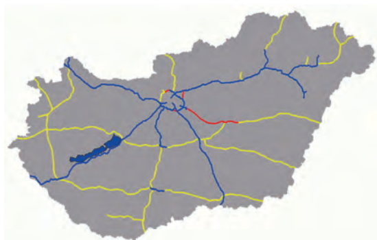
Abb.II.6.4 Autobahnnetz in Ungarn, blau: nutzbar, rot: im Bau, gelb: in Planung

Das Land verfügt über ein befestigtes Straßennetz von 76.100 km, wovon 1500 km Autobahn sind. Dabei sind Straßen und Autobahnen auf die Hauptstadt Budapest ausgerichtet. Absicht ist es, das Autobahnnetz flächendeckend auszubauen. Von dem 9200 km langen Schienennetz – ebenfalls Ausrichtung auf die Hauptstadt – sind 2900 km elektrifiziert. Physikalische Struktur und Verkehrsnetz machen Ungarn zu einer Drehscheibe für militärische Operationen in Ost-Südosteuropa in alle Richtungen.