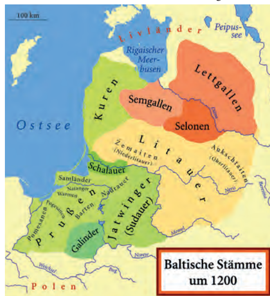
Abb.II.2.2 Baltische Stämme um 1200

Riga wurde 1282 deutsche Hansestadt. Bis heute prägt der deutsche Einfluss die markante Altstadt. Mit der vernichtenden Niederlage des Deutschen Ordens bei Tannenberg fielen Teile Lettlands 1410 an das römisch-