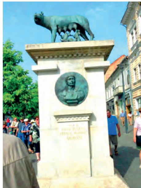
Abb.II.7.4 Kapitolinische Wölfin von 1921 in Cluj-Napoca/Klausenburg: Sinnbild der Romanitas

Mit der Entstehung des Nationalstaats ändert sich dies im 19. und 20. Jahrhundert. Geschichte wird national gedeutet, es entstehen Kontinuitätskonstrukte, die in rumänischer Perspektive bis in die Römerzeit zurückreichen. Aus der zeitlichen Tiefe werden Legitimation und Sonderstellung abgeleitet. Zwischen den Weltkriegen, in großrumänischer Zeit, wird das nationale Paradigma massiv durchgesetzt. Inbegriff der besonderen Position des Rumänischen ist der Rückbezug auf die Zeit des Imperium Romanum, der materiell in den Standbildern der Kapitolinischen Wölfin zum Ausdruck kommt, wie sie in vielen großen Städten des Landes zu sehen sind. Die so verstandene Romanitas (Dako-Romanismus) wird auch, und zwar mit Nachdruck, im zuvor ungarisch dominierten Siebenbürgen propagiert.