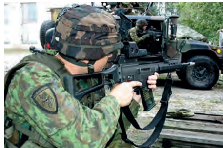
Abb.II.3.5 Litauische Infanterie beim Gegenangriff

Die Aus- und Weiterbildung der litauischen Soldaten wird zentral koordiniert. Für die Ausbildung stehen das Hetman Jonušas Radvila Ausbildungsregiment, das General Adolfas Ramanauskas Kampfttrainingszentrum und die Divisionsgeneral-Stasys-Raštikis-Militärschule zur Verfügung. Die Offiziersausbildung erfolgt an der General Jonas-Žemaitis-Militärakademie. Darüber hinaus gibt es zahlreiche Bildungseinrichtungen, die gemeinsam mit den estnischen und lettischen Streitkräften betrieben werden. Hier sei beispielhaft nur die Baltische Verteidigungsakademie (BALTDEFCOL) in Tartu genannt, an der die angehenden Stabsoffiziere der baltischen Republiken ausgebildet werden.