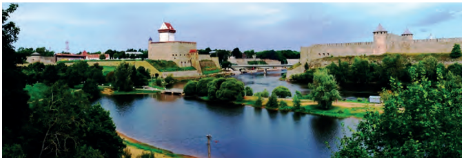
Abb.II.1.9 Estnisch-russischer Grenzfluss Narva

Estnische Politiker im Besonderen und baltische Akteure im Allgemeinen hatten es dabei in den letzten Jahren schwer, den Westen von der unmittelbaren Bedrohung durch Russland zu überzeugen und entsprechenden Beistand zu organisieren. Sie bekommen aber seit Mitte 2015 zunehmend breite westliche Unterstützung (DER SPIEGEL 2016, METZ 2016) durch breitangelegte gemeinsame NATO-Manöver im baltisch-polnischen Raum.