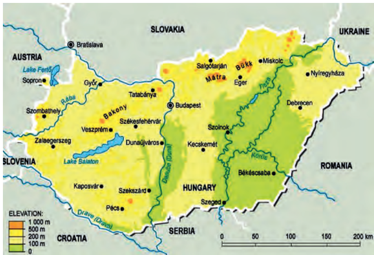
Abb.II.6.2 Topographische Darstellung Ungarns