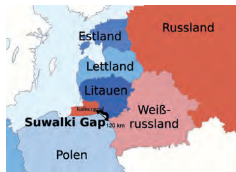
Abb.II.3.6 Suwalki-Korridor (Gap)

Es gibt keine Feindstaaten. Dennoch wird aus der russischen Politik in Osteuropa, der Annexion der Krim und der hybriden Kriegführung in der Ukraine sowie der militärischen Fähigkeiten Russlands eine Bedrohung