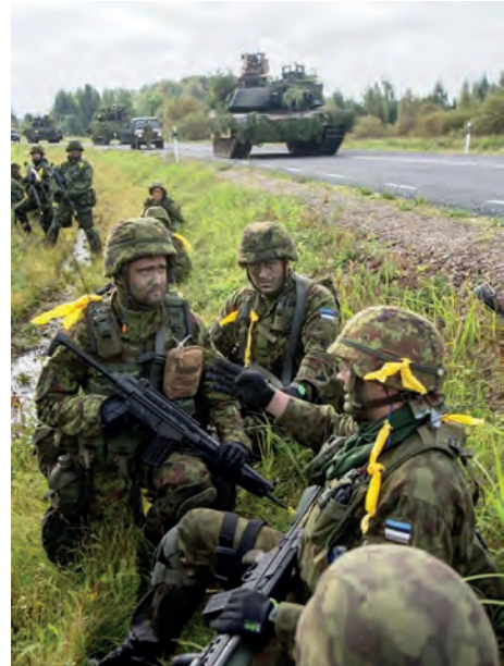
Abb.II.1.8 Estnische und amerikanische Truppen bei einer Übung im Baltikum

Territoriale Aufgaben übernimmt eine Heimwehr aus Reservisten (Defence League, Katseliit) mit 15 Distriktkommandos und nachgeordneten Einheiten in einer Stärke von etwa 11.000 Mann, deren Zielgröße 30.000 in den nächsten Jahren vorgesehen ist. Sie hat eine eigene Ausbildungseinrichtung, Jugend- und Frauenorganisation. Die Mitglieder der Reserve haben Waffen und Uniformen zuhause und sind in Friedenszeiten in zahlreiche zivilrechtliche Aufgabenbereichen (wie etwa Waldbrandbekämpfung, Veranstaltungssicherung etc.) eingebunden.