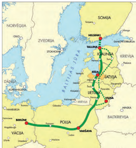
Abb.II.2.5 Rail Baltica

Der Schienenverkehr verwendet das Breitspurschienennetz Russlands, das nicht mit den europäischen Spurbreiten kompatibel ist