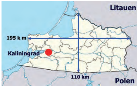
Abb.II.3.7 Russische Exklave Kaliningrad

Das Gebiet von Kaliningrad (ehemals Königsberg) ist etwa so groß wie Schleswig-Holstein. Vor dem Zweiten Weltkrieg gehörte das ehemalige Königsberg zu Ostpreußen und war Getreide-, Milch und Fleischlieferant für Deutschland. Nach 1945 fiel die Provinz an die Sowjetunion. Die 1,2 Millionen Deutschen wurden vertrieben und die Provinz von sowjetischen Bürgern besiedelt. Es ist der westlichste Teil Russlands. 700 Kilometer trennen das Gebiet vom übrigen russischen Territorium.