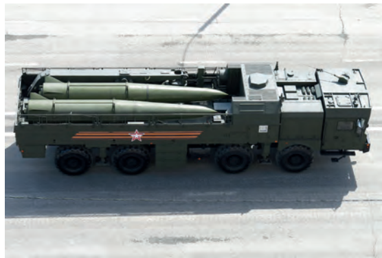
Abb.II.3.8 Wahrgenommene Bedrohung im Baltikum: Russische Iskander Kurzstrecken-Raketen

Im Jahr 2015 verlegte das russische Militär während eines großangelegten Manövers eine moderne Iskander-Kurzstrecken-Raketeneinheit nach Kaliningrad, um eine schnelle Reaktionsfähigkeit zu demonstrieren. Die Iskander-Raketen können mit konventionellen und nuklearen Sprengköpfen ausgestattet werden und haben eine Reichweite von 500 Kilometern. Damit können sie einen großen Teil Polens erreichen. Die Iskander-Raketen wurden nach den Manövern zurück an ihre ursprünglichen Standorte in Russland gebracht. Russland hat aber damit unter Beweis gestellt, dass die Raketen langfristig jederzeit erneut in der Kaliningrader Region stationiert werden könnten.