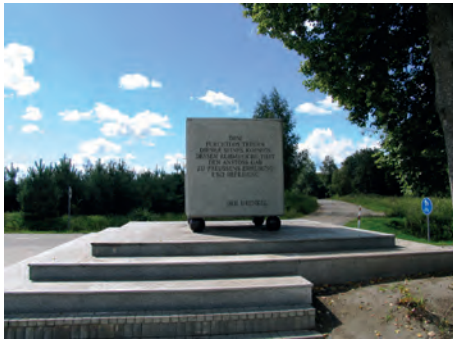
Abb.II.3.9 Konventionsdenkmal für Johann David Ludwig Graf Yorck von Wartenburg, dem Schöpfer der Konvention von Tauroggen und den Beginn der Freiheitskriege gegen Napoleon I. auf dem Gelände der ehemaligen Mühle von Poscherun in Litauen nahe der russischen Grenze.

Mit großem Enthusiasmus sind die Litauer 2004 sowohl der EU als auch der NATO beigetreten. Angesichts der mehr als 45jährigen Okkupation durch die Sowjetunion und der daraus erlittenen Unfreiheit waren diese Beitritte für alle Litauer generationsübergreifend Ausdruck einer Rückkehr in ein freiheitliches Europa.