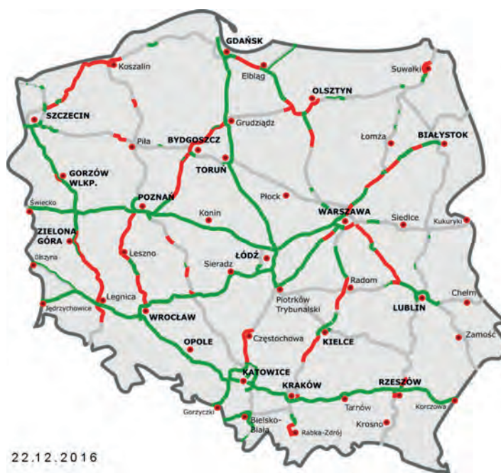
Abb.II.4.3 Verkehrsinfrastruktur Autobahnen, grün = verfügbar, rot = im Bau und grau = in Planung.

Obwohl es sich bei Polen um eins der bedeutendsten Länder innerhalb der EU handelt, muss man immer noch starke Mängel in der Verkehrsinfrastruktur konstatieren.