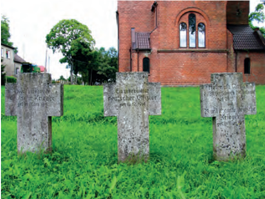
Abb.II.3.3 Deutscher Soldatenfriedhof in Marijampolė

Das Ende des Ersten Weltkrieges brachte die Gründung der Ersten Litauischen Republik. Die junge Republik konnte sich jedoch nicht gegen die territorialen Ansprüche Polens rund um Vilnius wehren, die von polnischen Truppen 1920 im Polnisch-Litauischen Krieg durchgesetzt wurden. Seinerseits annektierte Litauen am 10. Januar 1923 das ostpreussische Memelland mit der Hafenstadt Memel (heute Klaipėda). Am 8. Mai 1924 wurde diese Annexion in der Memelkonvention vom Völkerbund anerkannt. Während der Zeit der ersten Republik gab es einen großen Aufschwung in der litauischen Kultur und Bildung um die Hauptstadt Kaunas.