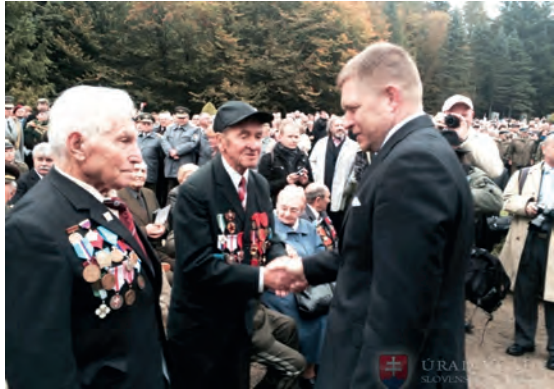
Abb.II.5.6 Ehrung von Veteranen

Oberbefehlshaber der Streitkräfte ist der Staatspräsident. Der Einsatz der Streitkräfte erfolgt auf der Basis von Parlamentsbeschlüssen. Die Streitkräfte bestehen aus Heer und