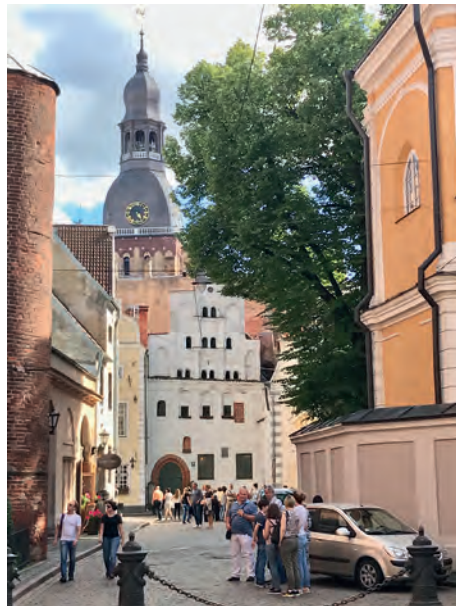
Abb.II.2.4 Hauptstadt Riga

Ethnische Letten stellen mit 62 Prozent der Einwohner die Mehrheit der Bevölkerung. Ihr Anteil ist damit etwa doppelt so groß wie der der ethnischen Russen von ca. 27 Prozent. In der Hauptstadt Riga sind 50 Prozent der Einwohner russischstämmig. In der zweitgrößten Stadt Daugavpils stellen Letten sogar nur etwa 20 Prozent. Weitere russischsprachige Gruppen wie Weißrussen, Ukrainer, Polen und Litauer machen insgesamt weitere zehn Prozent aus. Zwischen den lettischen und den russischsprachigen Bevölkerungsgruppen besteht ein massives Spannungsverhältnis, das auch dem besonderen Konstrukt der „Nichtbürger“ zugrunde liegt. Auf dieses wird in einem gesonderten Abschnitt eingegangen. Esten, Deutsche, Roma und Tataren stellen kleinere Minderheiten. 2880 Suiti – eine katholische Gruppierung – und ca. 170 nicht mit den Letten assimilierte