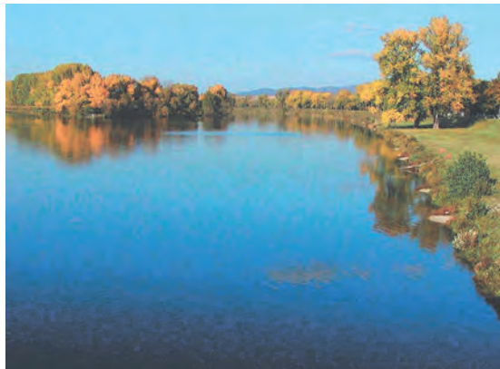
Abb.II.5.3 Fluß Waag

Die Vegetation in der Slowakischen Republik wird stark durch die Höhenstufung geprägt. Bis 500 m ü. NN wachsen vorwiegend Laubwälder, welche meistens aus Eichen und Hainbuchen bestehen, bis 1000 m ü. NN Mischwälder und darüber Nadelwälder. Oberhalb der Waldgrenze, die bei 1500 m ü. NN liegt, findet man Latschen und Zirbelkiefern, die ab 1650 m ü. NN von alpinen Matten abgelöst werden. In den abgelegenen Regionen der Slowakei finden sich Tierarten, die in