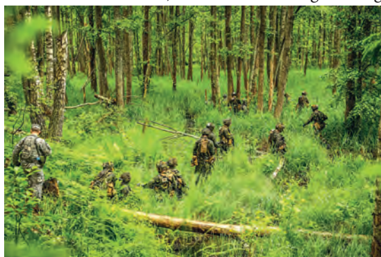
Abb.II.2.6 US- und kanadische Truppen bei der Übung Sabre Strike 2014 im waldreichen ostwärtigen Grenzgebiet Lettlands

Lettland hat sich trotz seiner geringen militärischen Stärke seit 1996 an zahlreichen Auslandseinsätzen beteiligt, um in der NATO und EU seine partnerschaftlichen Absichten zu beweisen. Zu diesen gehören die Operation Iraqi Freedom im Irak, der ISAF-Einsatz in Afghanistan, die ALTHEA Operation der