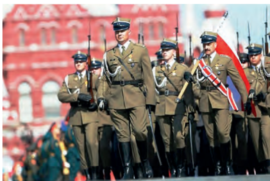
Abb.II.4.8 Polnische Militärformation bei einer Parade. Die polnischen Streitkräfte haben zwei optische Alleinstellungsmerkmale: Der Gruß mit zwei Fingern und eine viereckige Mütze.

Im Hinblick auf das Verhältnis zu Russland muss man von einer erheblichen Verschlechterung der bilateralen Beziehungen sprechen, welche vor allem nach der Katastrophe von Smolensk einsetzte und sich im Zuge der Kämpfe in der Ukraine und dem damit aufkommendem Bedrohungsgefühl vertiefte, was vor allem daran lag, dass die bürgerlich-liberale Regierung, die von 2007 bis 2015 in Polen an der Macht war, aus russischer Perspektive betrachtet, zu einem Erfüllungsgehilfen der USA wurde (BIALEK 2016) und eine rein transatlantische Ausrichtung vertrat. Die Verhandlungen zwischen Polen und den USA bezüglich der Installation von Teilen eines globalen Raketenabwehrsystems im polnischen Redzikow werden von Moskau als unverantwortliche Gefährdung der internationalen Sicherheitsarchitektur angesehen (PIWAR 2016). Der russische Botschafter in Warschau stellte jedoch im selben Atemzug heraus, dass Russland an eine Verbesserung der bilateralen Beziehungen zwischen beiden Staaten glaubt, sofern Polen seine einseitige Ausrichtung der Außenpolitik Richtung Washington aufgibt. Sollte dies erfolgen, so der Botschafter, könnten Russland und Polen auf jedem Gebiet zusammenarbeiten.