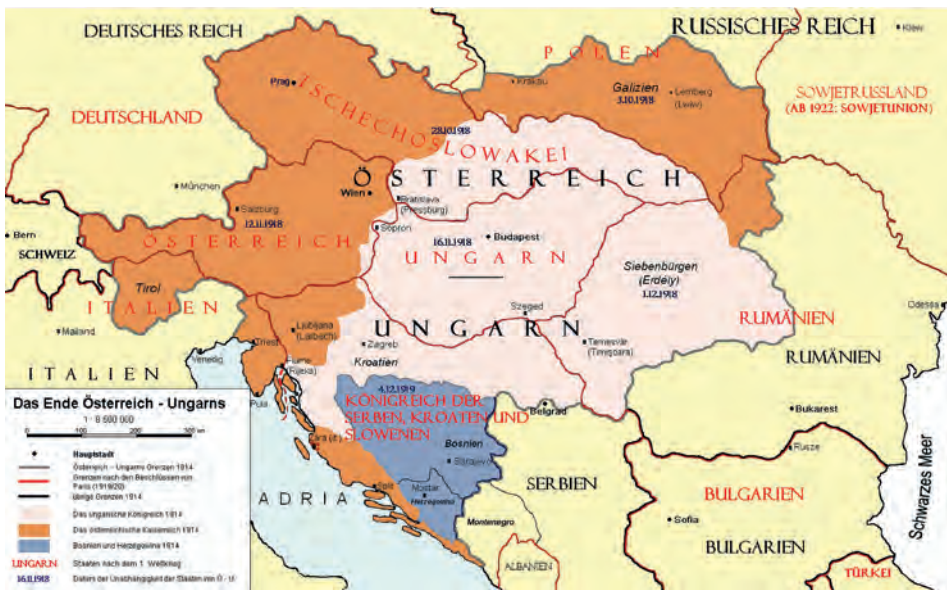
Abb.II.6.6 Aufteilung von Trianon; in der Mitte das räumlich deutlich kleinere heutige Ungarn.

Zurück in Budapest proklamierte er am 16. November 1918 die Republik Ungarn und wurde am 16. Januar 1919 zum provisorischen Präsidenten ernannt. Die harten Waffenstillstandsbedingungen und die Fortsetzung der alliierten Seeblockade gegen die Mittelmächte verursachten ein unbeschreibliches Elend in den großen Städten. Das war der ideale Nährboden für die Errichtung einer bolschewistischen Räterepublik unter Béla Kun am 21. März 1919. Der einsetzende bolschewistische Terror nach dem Muster der Sowjetunion und die Unfähigkeit der ungarischen Räteregierung, der Not leidenden Bevölkerung rasche Abhilfe zu verschaffen, isolierten diese schnell. Konservative Kräfte kamen mit „weißem“ Gegenterror an die Macht und setzten am 1. März 1920 Admiral Miklós Horthy als Reichsverweser ein. Das war der Beginn einer 24 Jahre währenden autoritären Herrschaft. Die Regierung Horthy war unter Widerspruch gezwungen, am 4. Juni 1920 den Friedensvertrag von Trianon zu unterschreiben. Ungarn verlor über 70 Prozent des bisherigen Staatsgebiets und damit zwei Drittel der Bevölkerung, darunter 2,5 Millionen Ungarn.