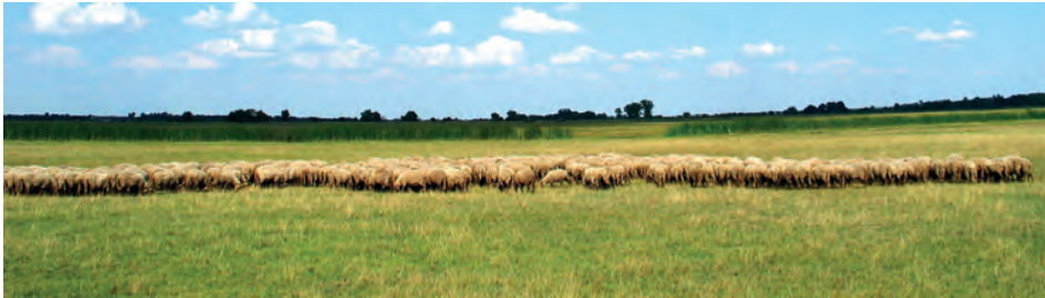
Abb.II.6.3 Ungarische Tiefebene

Das Land wird von einem weitmaschigen Flussnetz durchzogen, wovon die Donau, die Drau, die Theiß und die Raab die bedeutendsten sind. Sie fließen ins Schwarze Meer. (ZGEOBW 2015). Die Bedeutung der Gewässerläufe ergibt sich aus über 1600 km schiffbarer Wasserstraßen auf der Donau und der Theiß und der Verbindung mit dem Rhein-Main-Donau-Kanal bis zur Nordsee.