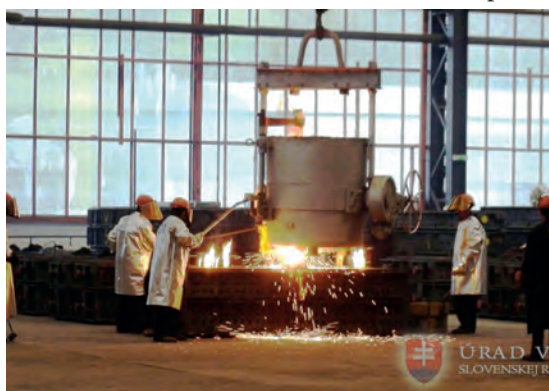
Abb.II.5.5 Slowakisches Stahlwerk