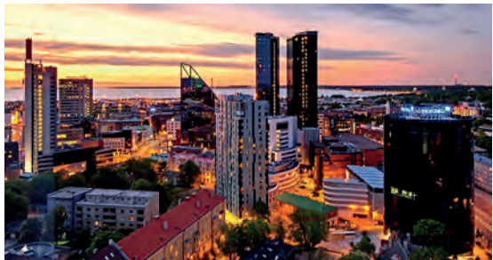
Abb.II.1.6 Tallinn bei Nacht

Obwohl der größte Teil der Bevölkerung Estlands keiner Konfession angehört, spielt der Faktor Religion über den Umweg des instrumentalisierten Ethnizität-Diskurs im Lande eine wichtige Rolle (REGELMANN 2017). Der weitaus überwiegende Teil der estnischen Bevölkerung ist konfessionslos, ca. 70 Prozent. Der Anteil der Mitglieder der Russisch-Orthodoxen Kirche macht etwa 12,8 Prozent aus; der evangelischen Kirche (Lutheraner) gehören 13,6 Prozent der Bevölkerung an. Die religiösen Minderheiten Estlands werden durch Katholiken (0,5 Prozent), Baptisten (0,5 Prozent) sowie Juden (0,1 Prozent), Muslime und weitere kleinere Religionsgemeinschaften repräsentiert.