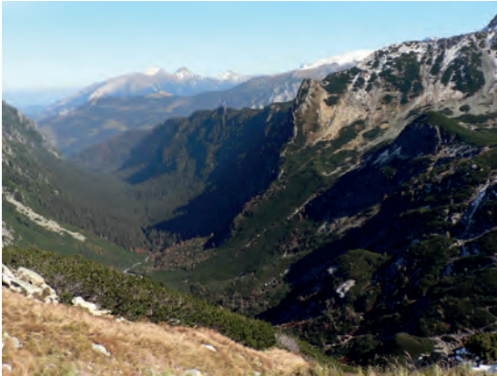
Abb.II.5.4 Hohe Tatra

Territoriums sind bewaldet, wobei man die größten Waldgebiete in der Niederen Tatra, in der Großen und Kleinen Fatra und im slowakischen Erzgebirge findet. Die ehemals reichen Bodenschätze der Slowakei, zum Beispiel Kupfer, Blei, Eisenerz, Braunkohle und Steinkohle sind heute weitgehend abgebaut und erschöpft.