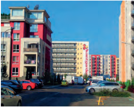
Abb.II.7.5 Neue Eigentumswohnungen am Stadtrand von Braşov/Kronstadt

Wohnungen; heute regeln Eigentümergemeinschaften alle anfallenden Probleme in den Bereichen Renovierung, Gemeinschaftseinrichtungen und Wohnumfeld. Parallel entstehen vielerorts nach der Jahrtausendwende postmoderne randstädtische Apartmentanlagen, Reihenhäuser und Villen, aber auch genossenschaftliche Wohnungen für Minderbegüterte. In den Dörfern bilden die Renovierungs- und Neubauaktivitäten das Pendant hierzu.