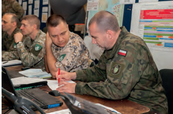
Abb.II.4.9 Arbeit im Gefechtsstand des MNC NE in Stettin während einer NATO-Übung Exercise Sabre Strike.

Angesichts der Ereignisse in der Ukraine wurden die Verteidigungsausgaben erhöht. In der Ende Mai 2017 veröffentlichten Verteidigungskonzeption werden für 2020 Ausgaben in Höhe von 2,2 Prozent des polnischen BIP veranschlagt, welche dann bis 2030 auf 2,5 Prozent steigen sollen. In diesem Dokument wird Russland als „Hauptquelle der Instabilität an der Ostflanke der NATO“ (MON 2017) bezeichnet, womit die Notwendigkeit steigender Verteidigungsausgaben begründet wird. Auch in Polen wird eine potentielle Gefahr eines begrenzten Angriffs russischer Streitkräfte in der polnisch-litauischen Grenzregion zur Schaffung einer Landverbindung zum Oblast Kaliningrad (Suwalki-Korridor) gesehen.