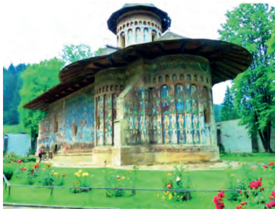
Abb.II.7.8 Moldaukloster Voronet; Inbegriff (1.) der rumänisch-orthodoxen Klosterwelt, (2.) der lange umkämpften moldauisch-osmanischen Kontaktzone sowie (3.) des heutigen Weltbetourismus.

Die Perspektiven für Rumänen und auf Rumänien haben sich grundlegend gewandelt. Das Karpatenland mit seinen fruchtbaren Schwarzerdeböden bietet hervorragende landwirtschaftliche Perspektiven, in Industrie und Gewerbe sind Internationalisierung und Globalisierung auf dem Vormarsch, die Probleme des Arbeitsmarkts werden durch internationale Migration und Rissen gemindert. Das Land und seine Bewohner bekommen durch die EU-Integration ein neues Pro-