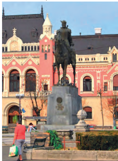
Abb.II.7.7 Michael der Tapfere (1558–1601); Standbild an einem symbolischen Ort erster Wahl in Oradea, das erst nach 1918 Rumänien zugeschlagen wurde.

Zusammenfassend liegen die Risiken des Landes bei der hohen Arbeitslosigkeit bzw. Unterbeschäftigung. Chancen zeigen sich weniger im Tourismus als vielmehr im Bereich der internationalen Logistik, der Arbeitsmigration sowie im lohnkostenintensiven Sektor der internationalen Arbeitsteilung. Als Schwäche kann die Vernachlässigung der inneren Peripherien gelten sowie die Gering-schätzung der multikulturellen Vergangenheit. Die Stärken des Landes könnten gerade in den Erfahrungen liegen, die an den Nahtstellen der Kulturen gesammelt wurden – doch diese Erkenntnis hat sich noch nicht durchgesetzt.