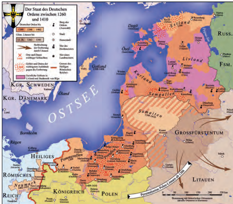
Abb.II.1.3 Besiedlung des Deutschen Ordens im Baltikum

sen Autonomiestatus wahr, der auch von der schwedischen Oberhoheit im nördlichen Ostseeraum bestätigt wurde. Auch nachdem Schweden im Großen Nordischen Krieg 1710 gegen Russland unterlegen war, blieben diese Selbstverwaltungsprivilegien weiterhin bestehen.