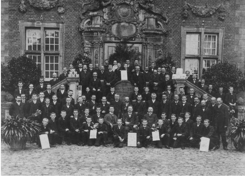
Abbildung 15: Die Belegschaft der Tabakfabrik Oldenkott im Innenhof des Schlosses (1919) 524

Die Übernahme des Schlosses als Wohnsitz, der Erwerb und die Wiederherrichtung des alten Schlossparks dürften dazu beigetragen haben, die soziale Stellung der Oldenkotts zu untermauern: Die fürstliche Familie Salm-Kyrburg verfügte nicht mehr über die Mittel, um das Wasserschloss samt Anlagen halten zu können – die Unternehmerfamilie Oldenkott jedoch schon. 525 Mit Blick auf das im Stadtbild besonders präzente Bauwerk waren die Fabrikanten damit im wahrsten Sinne des Wortes an die Stelle der kirchlichen und weltlichen Fürsten getreten.