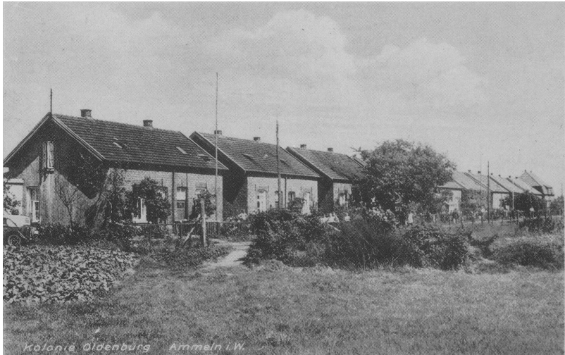
Abbildung 14: Werkwohnungen in der Colonie Oldenburg (1930er-Jahre) 495